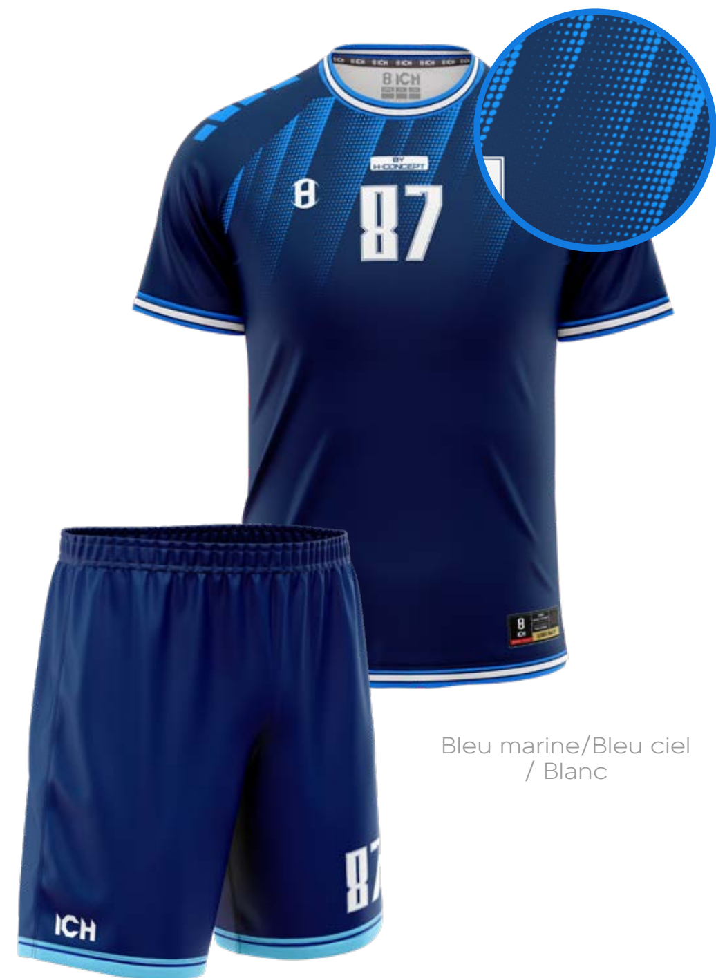
Bleu marine/Bleu ciel / Blanc