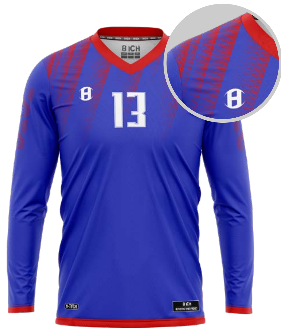
Bleu marine/Bleu ciel / Blanc